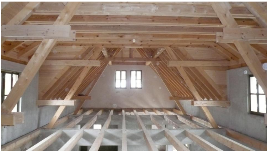
Etno muzej u Šabićima, Bjelašnica