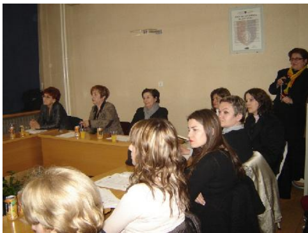
Na slici prikazani učesnici okruglog stola

Projekat je ishodio dobre rezultate i ukazao na potrebu nastavka rada grupa samopomoći. Formiranje grupa samopomoći predstavlja inovativni model rada koji obuhvata počinitelja nasilja i žrtvu nasilja. Kroz primjenu porodične terapije radi se na saniranju poremećenih porodičnih odnosa. To predstavlja prevenciju nastavka nasilja, ali i reduciranje postojećeg nasilja.