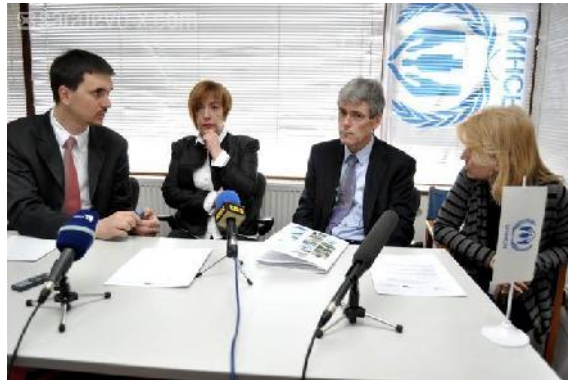
Press konferencija povodom otvaranja Centra za žene

za 52 korisnice Centra. Uglavnom se radilo o žrtvama nasilja, samohranim majkama, ženama na socijalnoj margini. Radilo se na osnaživanju žena za preuzimanje aktivnije uloge u svim segmentima svog života, podizanje svijesti o pravima i odgovornostima, podizanje znanja i vještina u traženju posla, osnaživanje u samostalnom rješavanju problema nezaposlenosti, podizanje svijesti o važnosti zapošljavanja, osnaživanja i podizanja svijesti u ulozi žene u zajednici, društvu, emocionalno i mentalno osnaživanje žene da izađu iz nasilničke situacije.