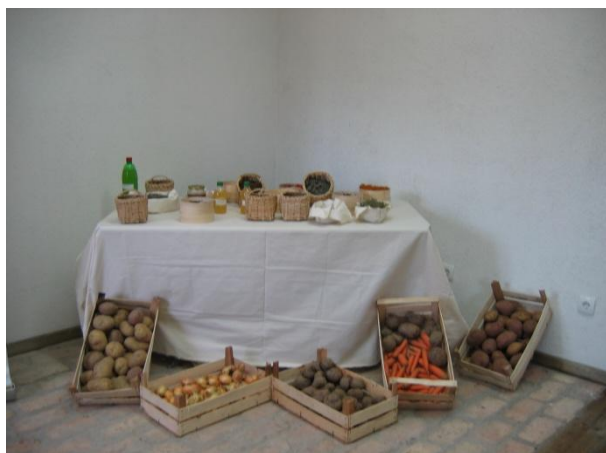
Organska proizvodnja hrane na Bjelašnici