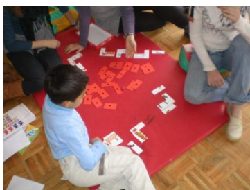
Slika 3: Igraonice su interesantne i malima i velikima

U realizaciji projekta su učestvovali uposleni Fondacije lokalne demokratije kao i volonterke (7 studentica Odsjeka za psihologiju), te studentica socijalnog rada na praksi. Radionice sa djecom, te pomoć u izradi domaćih zadataka realizirao Elvis Hrvat, dipl.scr.