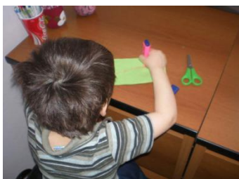
Slika 1: Tokom radionice za najmlađe korisnike

Kupljene radionice/igraonice za djecu stariju od 2 godine, koje nisu potrošni materijal, te se trajno mogu koristiti u cilju učenja kroz igru (alfa, beta i gama radionice).