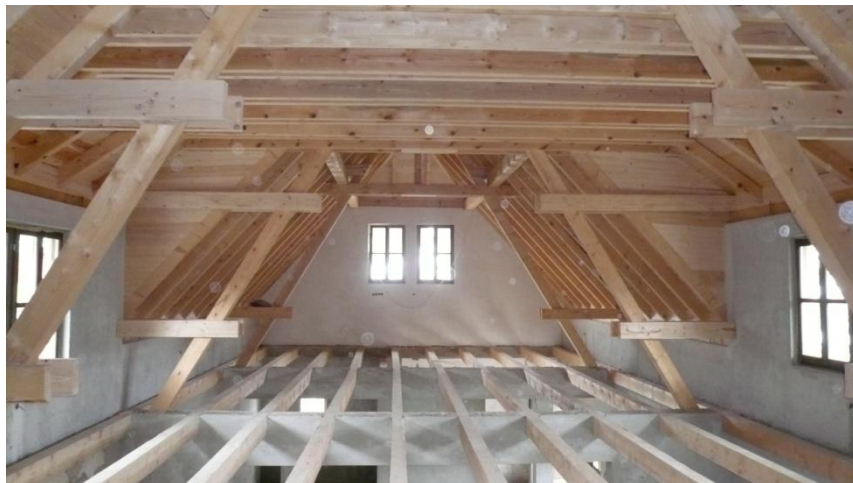
Etno muzej u Šabićima, Bjelašnica