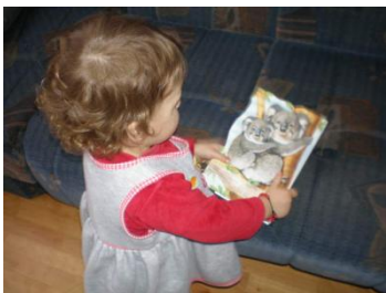
Slika 2: „I ja se znam koristiti bibliotekom“

osnovnim i srednjim školama. Sve knjige su evidentirane po registarskim brojevima i koriste se kao i u bilo kojoj drugoj biblioteci ili čitaoni.